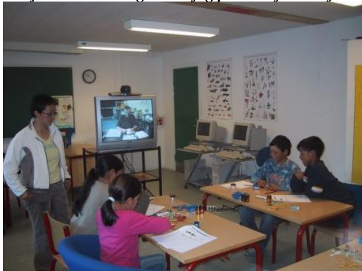
Fjernundervisning i naturfag på Atuarfik Pilerfik

På 6.klassetrin gennemføres et modul med fysikundervisning via TV. Modulet evalueres både af den lokale underviser/observatør og af fjernunderviser og observatører.