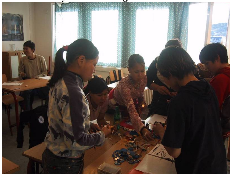
Fysikundervisning i Ukkusissat

Under målsætningsarbejdet tages begrebet indsatsområder op. Hvordan arbejdes der med dem?